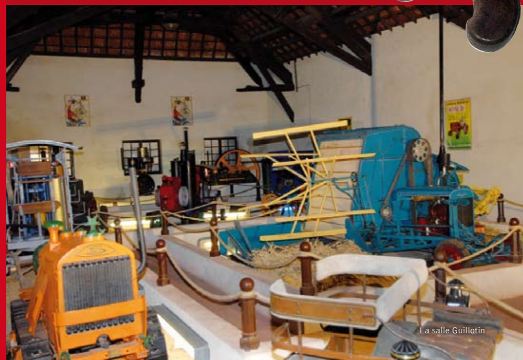
La salle Guillotin