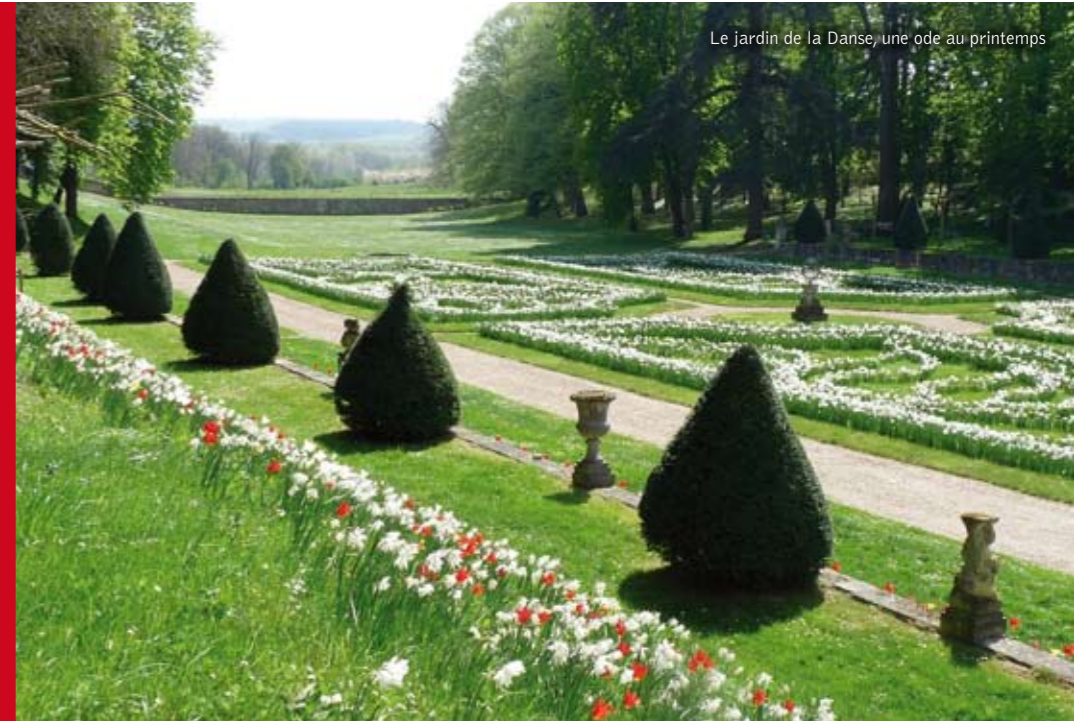
Le jardin de la Danse, une ode au printemps