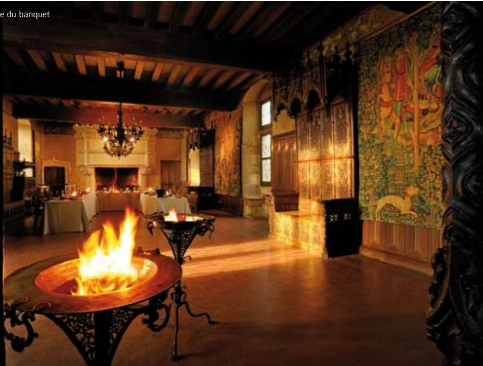
La salle du banquet