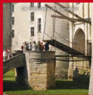
Le Pont-levis de Langeais