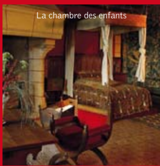
La chambre des enfants