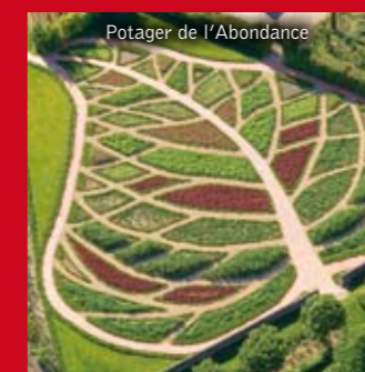
Potager de l'Abondance