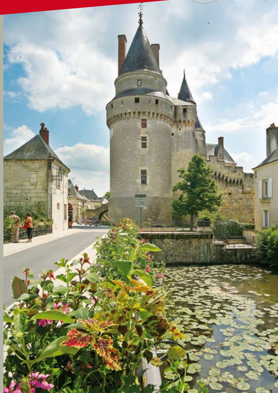
Château de Langeais

www.cv.fr • Crédits photos : J.M. Laugery, J. B. Rabouan, Pixalle, Comdiart, Stevens Frémont, Jean-Pierre Klein.