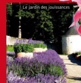
Le jardin des jouissances