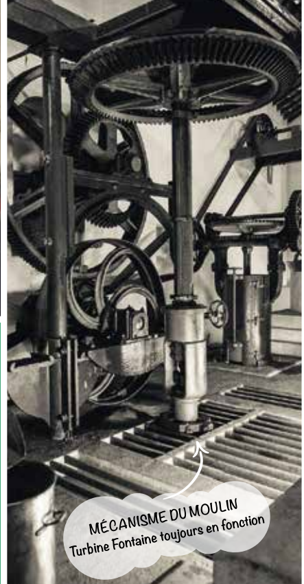
MÉCANISME DU MOULIN Turbine Fontaine toujours en fonction

La folle aventure d'un Ferrailleur-Visionnaire et de sa collection Hors-Norme de 3000 machines à remonter le temps The Crazy Adventure of a Visionary Scrap Metal Dealer and His Extraordinary Collection of 3000 Time Machines