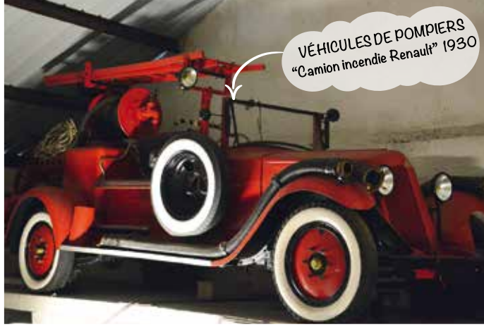
VÉHICULES DE POMPIERS "Camion incendie Renault" 1930