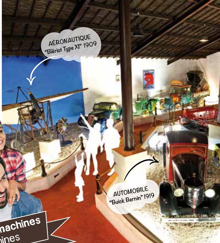
AÉRONAUTIQUE "Blériot Type XI" 1909