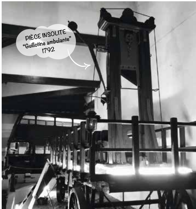
PIÈCE INSOLITE "Guillotine ambulante" 1792

La folle aventure d'un Ferrailleur-Visionnaire et de sa collection Hors-Norme de 3000 machines à remonter le temps The Crazy Adventure of a Visionary Scrap Metal Dealer and His Extraordinary Collection of 3000 Time Machines