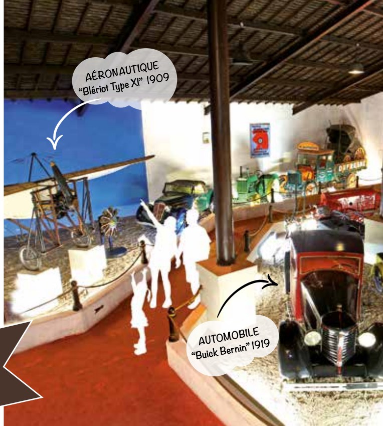
AÉRONAUTIQUE "Blériot Type XI" 1909

2 h de visite a 2-hour visit 3000 machines 3,000 machines