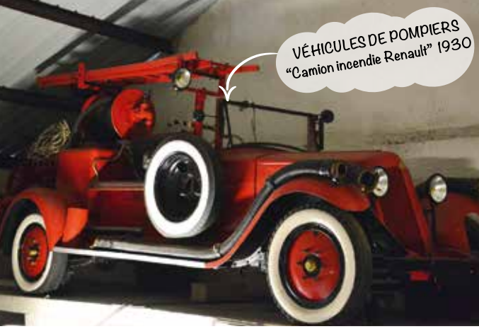
VÉHICULES DE POMPIERS "Camion incendie Renault" 1930