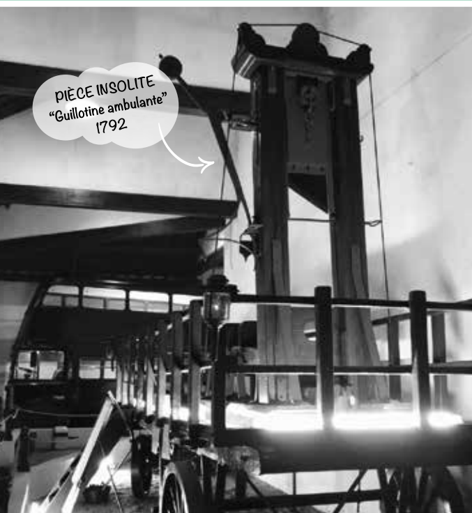
PIÈCE INSOLITE "Guillotine ambulante" 1792

The Crazy Adventure of a Visionary Scrap Metal Dealer and His Extraordinary Collection of 3000 Time Machines