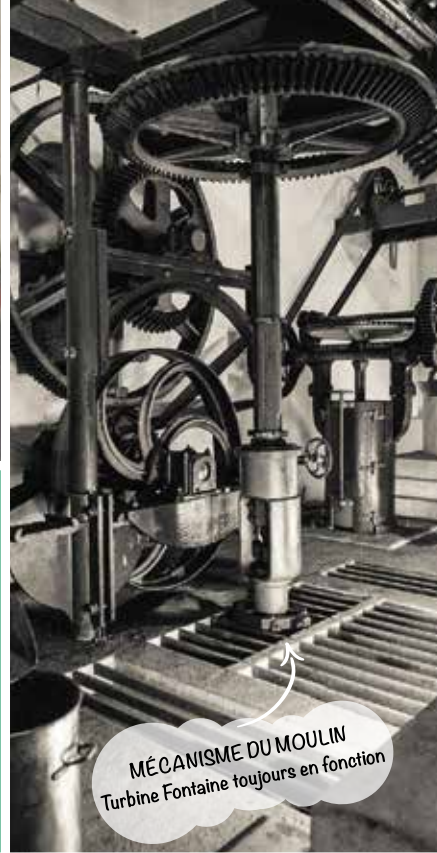
MÉCANISME DU MOULIN Turbine Fontaine toujours en fonction